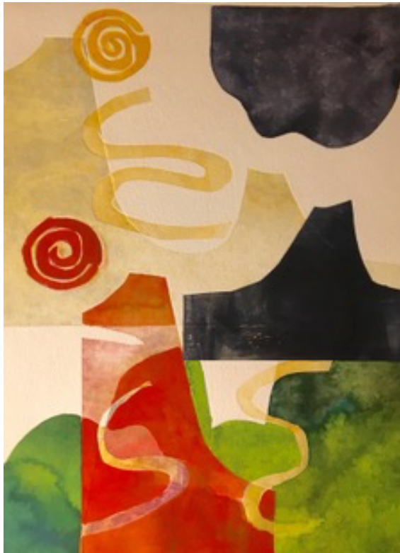
"Castelmola" av Lise Lundgren